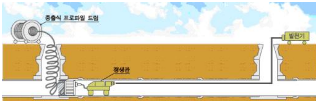
<그림 1.1.2> 자주식 제관방식

자주식 제관방식은 그림 B.2와 같이 자주식 제관기를 기존관 내에 설치하여 지상에 설치된 중출 드럼으로부터 연속적으로 프로파일을 제관기로 보내고 프로파일을 관로의 형상에 따라 기존 설치 관내를 자주 제관하는 방법으로 (600~5,000) mm의 자유단면에 사용한다. 제관이 완료된 후에 나선형 제관 파이프와 기존관 사이의 공간은 프로파일과 접촉할 수 있는 상용화된 실링 재료를 사용하여 양끝 부분을 실링 처리한다.